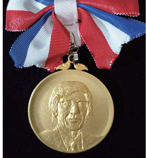
名誉会員である松井先生に森代表理事よりゴールドメダルが授与された。 授与されたゴールドメダル 表は松井先生の顔型、裏は日本腹部放射線学会のロゴであり、石膏彫刻の過程を経て作製された。